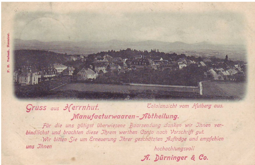
Eine Postkarte der berühmten Firma Dürninger aus Herrnhut um 1900