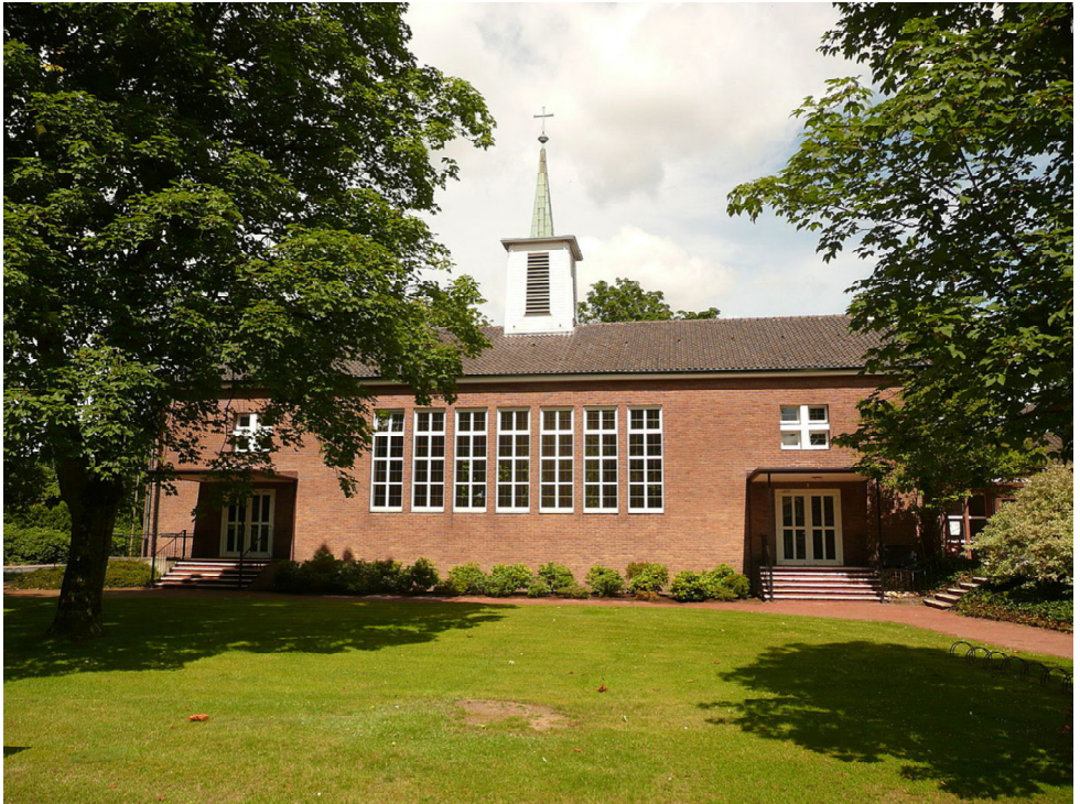
Neugnadenfeld in der Grafschaft Bentheim

In Niedersachsen haben wir eine Herrnhuter Gemeinde, in Neugnadenfeld in der Grafschaft Bentheim, die 1945 nach dem Krieg dort gegründet wurde. Auch hier macht der Mitgliederschwund nicht halt – heute zählen sich im Ort noch knapp die Hälfte der ca. 700 Einwohner zur Gemeinschaft.