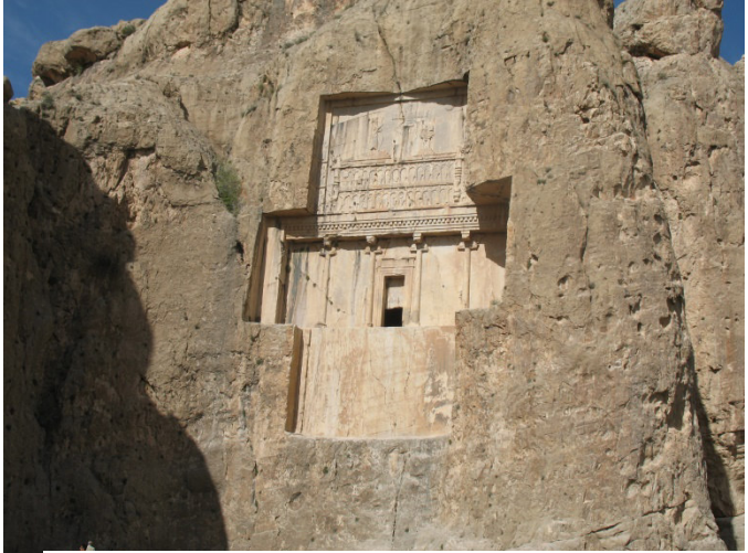
Grabkammer des Xerxes in der persischen Provinz Fars – nahe Persepolis / Iran

Der persische Regent Xerxes I. (* um 519 v. Chr.) wird im Alten Testament im Buch Esther erwähnt und die Geschichte um Esther ist eine der prächtigsten Erzählungen in der alten jüdischen Geschichte. Immer wieder haben sich Künstler mit dieser Thematik beschäftigt, erinnert sei hier nur an Georg Friedrich Händels (1685 – 1759) gleichnamige Oper.